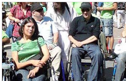
Miembros de Vigalicia, tras la 'performance' en Jacinto Benavente